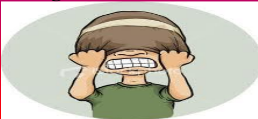
Frust / Ärger